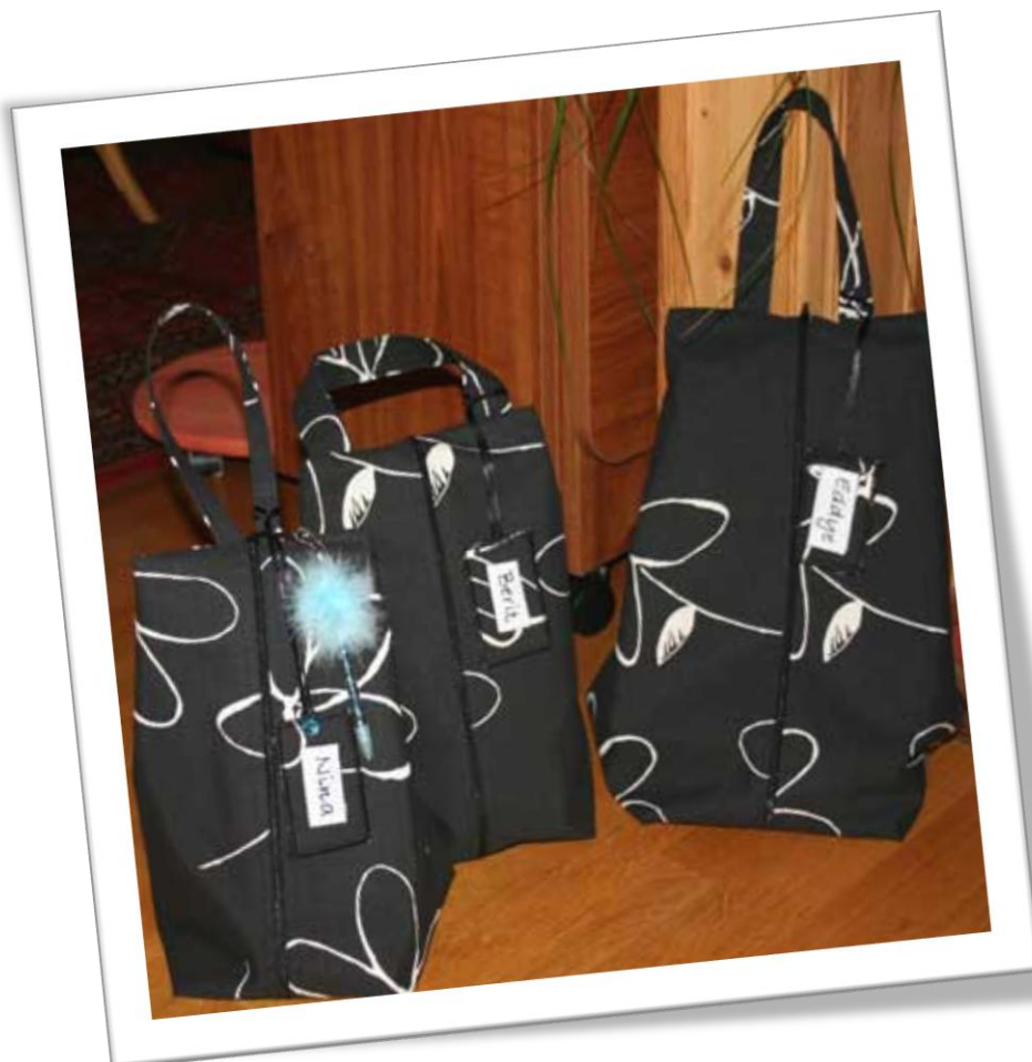
Tripp-trapp-tresko. Skovesker til far, mor og datter.

Min venninne hadde behov for skoveske til sin mann. Han hadde en tendens til å komme med sine sko etter at han hadde pakket bagen. Skoene var ikke alltid like rene som da de første gang kom ut fra skoeken.